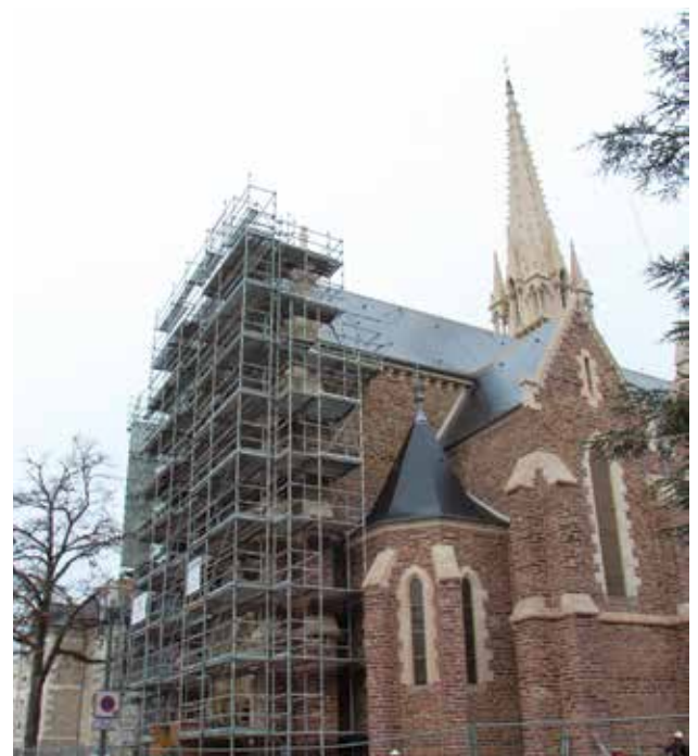
La dépose de l'échafaudage en janvier marque la fin des travaux de rénovation de l'église.