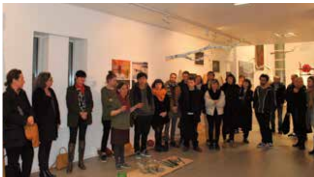
Vernissage de l'exposition Émergence à la Galerie Pictura le mardi 13 décembre. Des œuvres des artistes diplômés de l'EESAB (École européenne supérieure d'art de Bretagne).