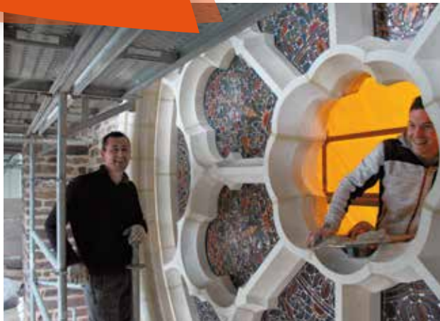
Pose des vitraux de la rosace de l'église St Martin, mardi 13 décembre.