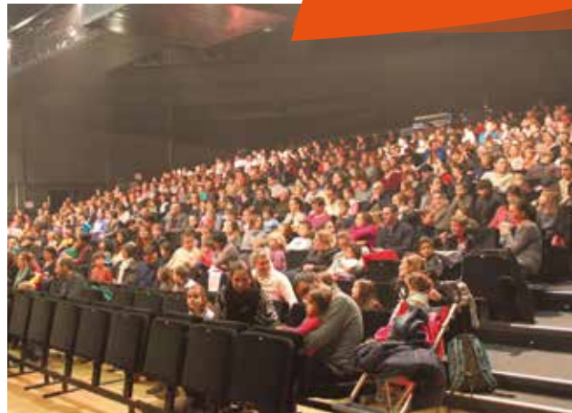
Le Noël des Petits Cessonnois, le samedi 14 janvier. Les 350 enfants qui ont déposé un dessin dans la boîte du Père Noël située dans le parc de la Chalotais étaient invités à un spectacle.