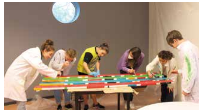
Des bancs publics ont été décorés par les jeunes de l'Escalé pendant les vacances de Noël. Les bancs ont été installés au parc de jeux de la Garenne.