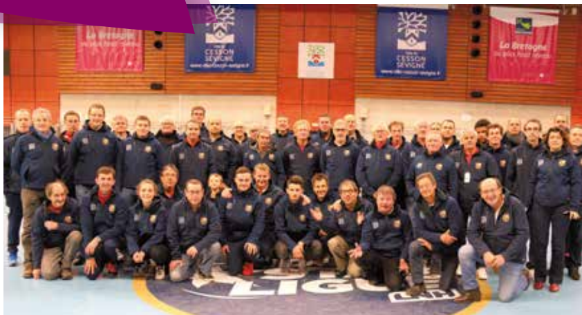
Les bénévoles ont reçu une veste pour les remercier de leur implication au quotidien pour le club de l'OCC Football.