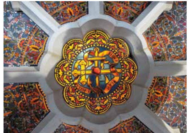
Ce sont les ateliers Helmbold, basés à Corps-Nuds, qui ont restauré les vitraux.