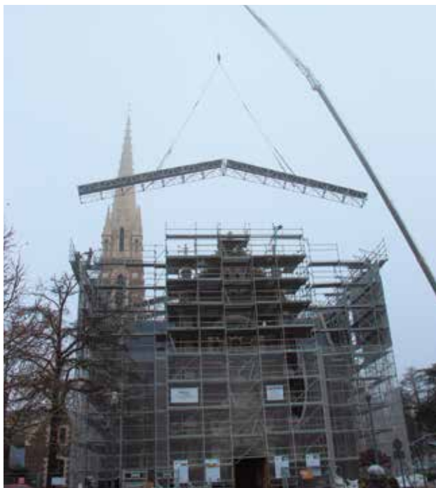
Dépose du parapluie protégeant le toit de l'église St Martin, jeudi 22 décembre.