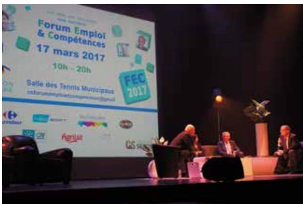
Les vœux aux acteurs de la vie économique locale se sont déroulés mercredi 18 janvier. L'occasion de présenter le forum emploi et compétences du 17 mars.